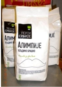
Сл. 7 Брашно