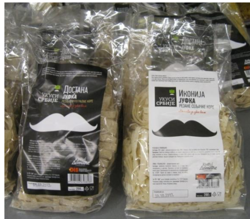
Сл. 13 Јуфка