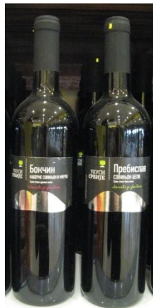
Сл. 12 Вина