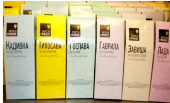
Сл. 10 Чајеви