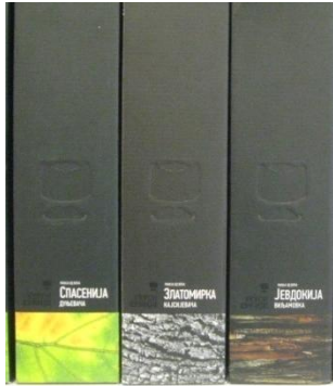
Сл. 9 Ракије