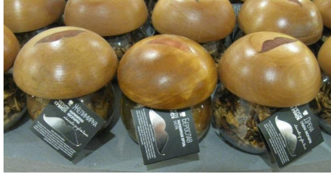
Сл. 8 Печурке